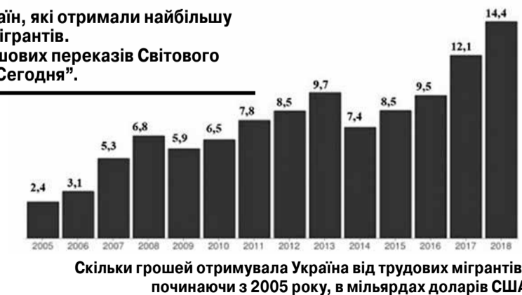
Скільки грошей отримувала Україна від трудових мігрантів, починаючи з 2005 року, в мільярдах доларів США

До України трудові мігранти переказали 2018 року 14,39 млрд доларів. Така сума дозволила нашій країні увійти до дюжини країн, які отримали найбільшу кількість грошей від трудових мігрантів. А також стати лідером за обсягом грошових пере-